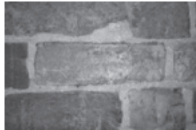
Leiden, Gravensteen algemeen zicht, muurwerk en afstrijkspoor aan de bovenzijde van de baksteen.

Kijken we nu naar de bakstenen in de Leidse Burcht dan blijken we met een geheel andere partij van doen te hebben. Een moeilijkheid met deze bakstenen is dat de vroege baksteen in de burcht slechts in kleine hoeveelheden aanwezig is. De stenen zijn langer en minder dik, en bovendien lijkt het kalkaandeel in de klei geringer te zijn, waardoor de gele kleur niet aanwezig is. Of deze stenen ouder of jonger zijn dan die in het Gravensteen en de toren in Rijnsburg, daarop is het antwoord momenteel nauwelijks te geven. Vast te stellen is wel, dat de tendens dat vroege bakstenen in Holland een strekkenmaat van circa 30 cm hebben, nauwelijks behulpzaam is bij het dateren van vroege baksteen. Dit inzicht heeft repercussies voor het kaartenhuis van veelal archeologisch gedateerde vroege bakstenen in Holland. De uit 1285 stammende bakstenen in de Haagse ridderzaal, met strekken tot 30 cm, laat overduidelijk zien dat een datering op basis van baksteenformaten niet onwaarschijnlijk een foutmarge van ongeveer honderd jaar kan opleveren.