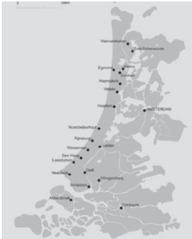
Kaart van het graafschap Holland.

Waarom produceren mensen bakstenen? Op die vraag zijn verschillende antwoorden mogelijk. Ten eerste omdat er behoefte aan is. De vraag naar bouwstenen overtreft het aanbod aan natuursteen, zodat er voor een kunstmatig alternatief wordt gekozen. Ten tweede omdat ze het kunnen ; omdat de techniek beschikbaar is en op zo'n efficiënte wijze kan worden ingezet dat baksteenproductie aantrekkelijker is dan import van natuursteen. 1 En ten derde omdat de geografische en demografische omstandigheden ervoor geschikt zijn. Grondstoffen zijn in de directe omgeving voorhanden en hoeven niet te worden geïmporteerd, terwijl de structuur van de samenleving zodanig is, dat een complex productieproces kan worden gecoördineerd, gefinancierd en gerealiseerd.