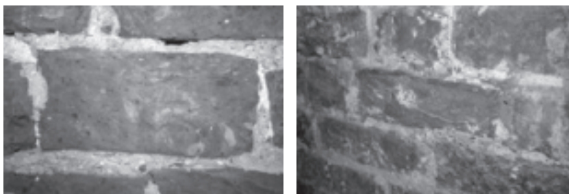
Rijnsburg, baksteen van gemengde rode en gele fijne klei en een afstrijkspoor aan de bovenzijde van de baksteen.

In de nog bestaande zuidelijke toren van de abdij van Rijnsburg zijn in de derde tot vijfde verdieping bakstenen bewaard gebleven van 29/30 x 13/15 x 9/10 cm. De toren is van buiten met tufsteen bekleed en is een restant van de abdijkerk uit het derde kwart van de 12de eeuw. Deze kerk werd in 1196 door brand beschadigd, waarna wederopbouw plaatsvond. De hier aan de binnenzijde van de toren gebruikte bakstenen dateren met grote zekerheid van relatief kort na de brand, vroeg in de periode 1200-1220. De kleur van de bakstenen is gemêleerd en varieert van geel en oranje, naar bruin en donker. De klei is relatief fijn, maar de wijze waarop deze is gemengd is hier en daar zeer grof. De bakstenen bevatten drukplooiën, van het in de vorm drukken van de klei, en zijn met de hand afgestroken. Een opvallend aspect van de stenen is een rand aan één zijde van de strek, die het gevolg is van het vormingsproces. In de stenen komen hier en daar vingerafdrukken voor en ook zijn in het muurwerk enkele gesinterde koppen aanwezig. De steen is gemetseld met een extreem grove schelpkalk.