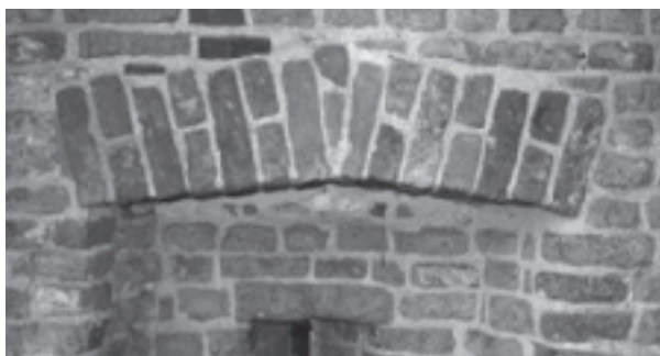
Leiden, Burcht en bakstenen boven schietgaten.