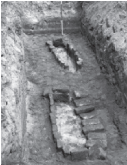
Egmond, abdijkerk, gemetseld graf tijdens opgraving

“De vraag naar den tijd en de plaats van ontstaan onzer baksteen-architectuur is een van de meest omstrede problemen der kunstgeschiedenis van West-Europa”, schreef F. Vermeulen in 1928. 2 Nog altijd heeft deze uitspraak zijn geldigheid niet verloren, hoewel andere auteurs nadien de kennis over de vroege productie en gebruik van baksteen aanzienlijk hebben vergroot en gepreciseerd. 3 E.H. ter Kuile stelde in 1935 dat de baksteen in de burchten van Leiden, Teylingen en Oost-Voorne uit de 11de eeuw stamden. 4 J.G.N. Renaud nuanceerde dit later en dateerde de bakstenen in Leiden (30/32 x 15/16 x 7,5/8,5 cm) pas omstreeks 1156, waarbij er tegenwoordig vanuit wordt gegaan, dat de stenen bij herstellingen na 1204 in de burcht zijn verwerkt. 5