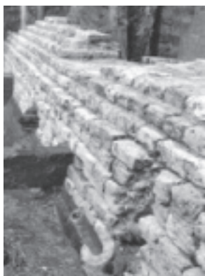
Amsterdam, fundament van het 'kasteel van Amstel' (Bureau Monumenten & Archeologie Stad Amsterdam, afdeling Archeologie).

De invoering van de baksteen gaat gepaard met een verandering in de kasteelbouw. 57 In het begin van de 13de eeuw verdwijnt de motte. Zware bakstenen constructies lieten zich moeilijk combineren met kunstmatig opgeworpen heuvels. In plaats daarvan werden ronde of polygonale burchten op het land gebouwd. 58 De oudste burcht van Teylingen, in Warmond, stamt uit de eerste helft van de 13de eeuw. De bakstenen in de ringmuur hebben formaten van 29/33,5 x 14/16 x 8 cm. De iets later gebouwde toren, tot welke fase ook de poort met twee poorttorens behoren, bezit stenen met een formaat van 29/30 x 14/15 x 8 cm. Uit de tweede helft van de 13de eeuw stammen de vierkante kastelen van Schiedam (Huis te Riviere), het eerste Muiderslot en Medemblik. Onregelmatige kasteeltypen uit de 13de eeuw zijn of waren te vinden in Nieuwburg en Nieuwendoorn van omstreeks 1290. 59 Het probleem met veel vroege kastelen is dat er nauwelijks iets van behouden is gebleven en dat de datering uitermate moeilijk is. Een voorbeeld is het vermeende kasteel van Amstel in Amsterdam. De bakstenen structuur werd waarschijnlijk omstreeks 1280 gebouwd, met bakstenen van 29/32 x 14/15 x 7/8 cm in wild verband. 60