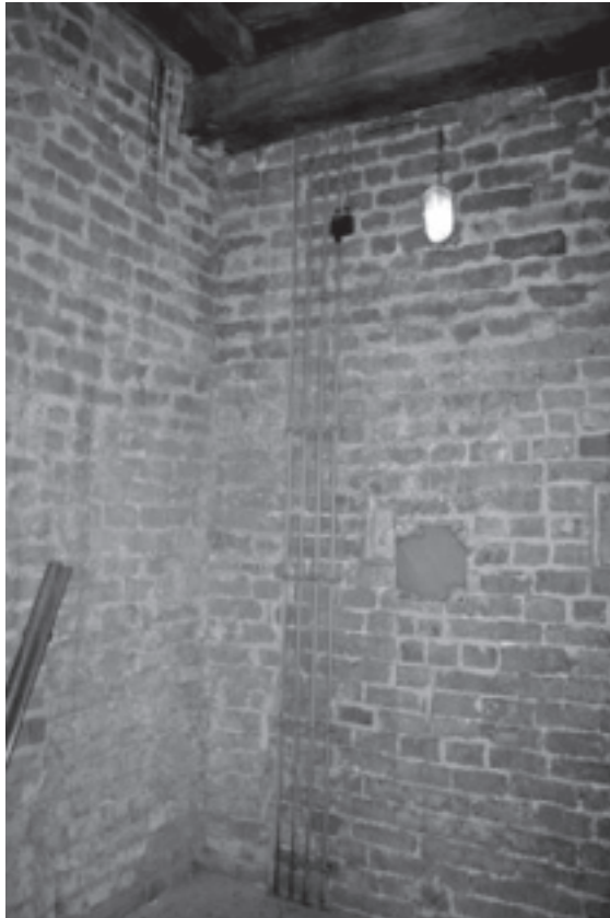
Rijnsburg, Nederlands Hervormde Kerk (voormalige abdijkerk), zuidelijke toren. Overgang van tufsteen naar baksteen.

Van de in het voorafgaande geïnventariseerde voorbeelden van baksteentoepassingen voor het jaar 1300 zijn de drie (verondersteld) vroegste aan een onderzoek ter plaatse onderworpen. 67 Hierbij is gelet op de afmeting, evenals het gebruikte metselverband en de tien-lagenmaten. In de volgorde van het productieproces is bovendien gekeken naar de kleur, de grofheid van de gebruikte klei en de vraag of er productiesporen zichtbaar waren. Hierbij valt te denken aan drukplooiën (sporen van het in de vorm drukken van de klei), afstrijksporen, doekafdrukken, sporen van waterlijnen, zandsporen, hand- of houtstrijklijnen en opzetranden. Ook werden afdrukken van gereedschap of andere afdrukken gezocht, zoals krassen die aantallen weergeven. Van het bakproces werd bekeken of er verglaasde koppen of glazuur aanwezig was en of de stenen van een kraspatroon waren voorzien. In het verlengde daarvan was het de beurt aan na het bakproces aangebrachte kenmerken, zoals ingekraste tekens, metselaarstekens of cirkels. Vanwege de aard van het materiaal werden architectonische aspecten buiten beschouwing gelaten. Wel werd gekeken naar het voegwerk.