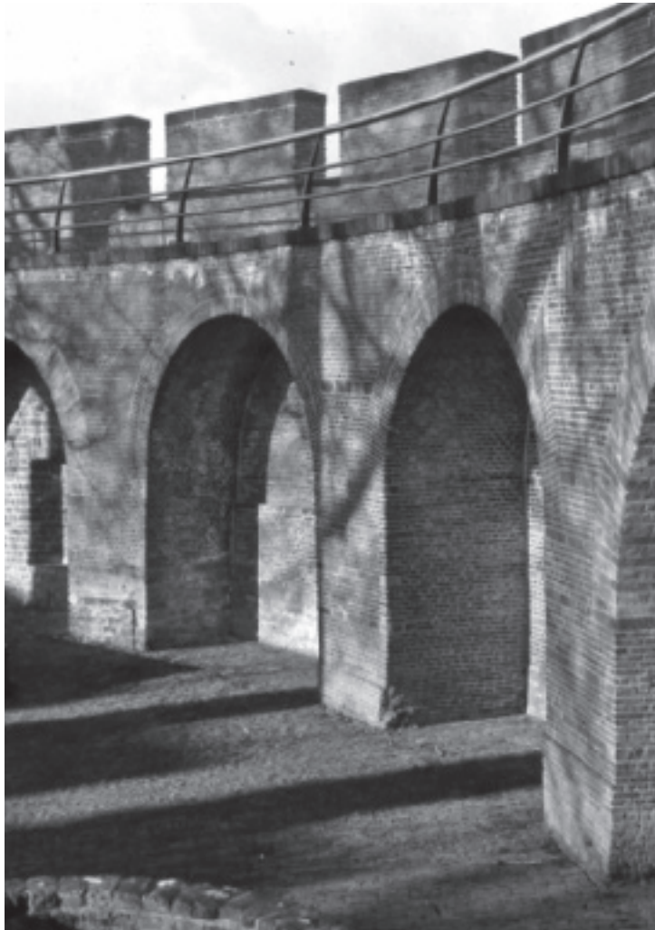
Leiden, boogstructuur aan de binnenkant van de zingmuur van de Burcht.