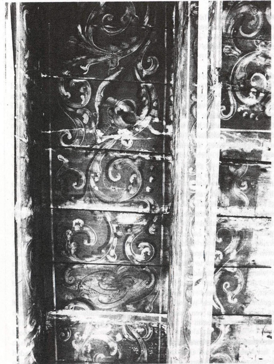
Afb. 1 Dijk 2-4. Deel van het uit omstreeks 1630 daterende beschilderde plafond op de eerste verdieping.

Een van de grachten, waar nogal wat woonhuizen met aardige oude gevels staan, is de Oudegracht. Daaronder een aantal vrij grote, die in de jaren na de oorlog hun oorspronkelijke woonhuisbestemming hebben verloren. Zo werd nr. 247, in de wandeling Huize Oort genaamd, in 1966 de zetel van het Gemeentearchief. Toen het Gemeentearchief Regionaal Archief werd, moest worden omgezien naar een groter pand. Tevens werd besloten om bij het afscheid van het oude pand een themanummer van het tijdschrift 'Oud-Alkmaar' aan Oudegracht 247 te wijden. Voor dit nummer, dat de titel " Een huis vol papier- van woonhuis tot stadsarchief" draagt (zie Oud-Alkmaar 1991, nr.4), hebben P. Verhoeven en ondergetekende het nodige onderzoek verricht naar bouw- en bewoningsgeschiedenis. Daarbij is zowel naar het huis zelf gekeken, als kaart- en archiefonderzoek verricht. Het bleek dat er geen sprake was van een laat-18de-eeuws pand, zoals o.a. in het al genoemde Kunstreisboek te lezen staat, maar om een zeer onregelmatig ingedeeld pand dat in kern deels uit het eind van de 16de eeuw, deels uit de eerste helft van de 17de eeuw moet stammen, en dat daarna verschillende belangrijke verbouwingen onderging. Bij een van die verbouwingen, in de eerste helft van de 18de eeuw, kreeg het voorhuis vermoedelijk zijn huidige hoofdvorm met lijst-