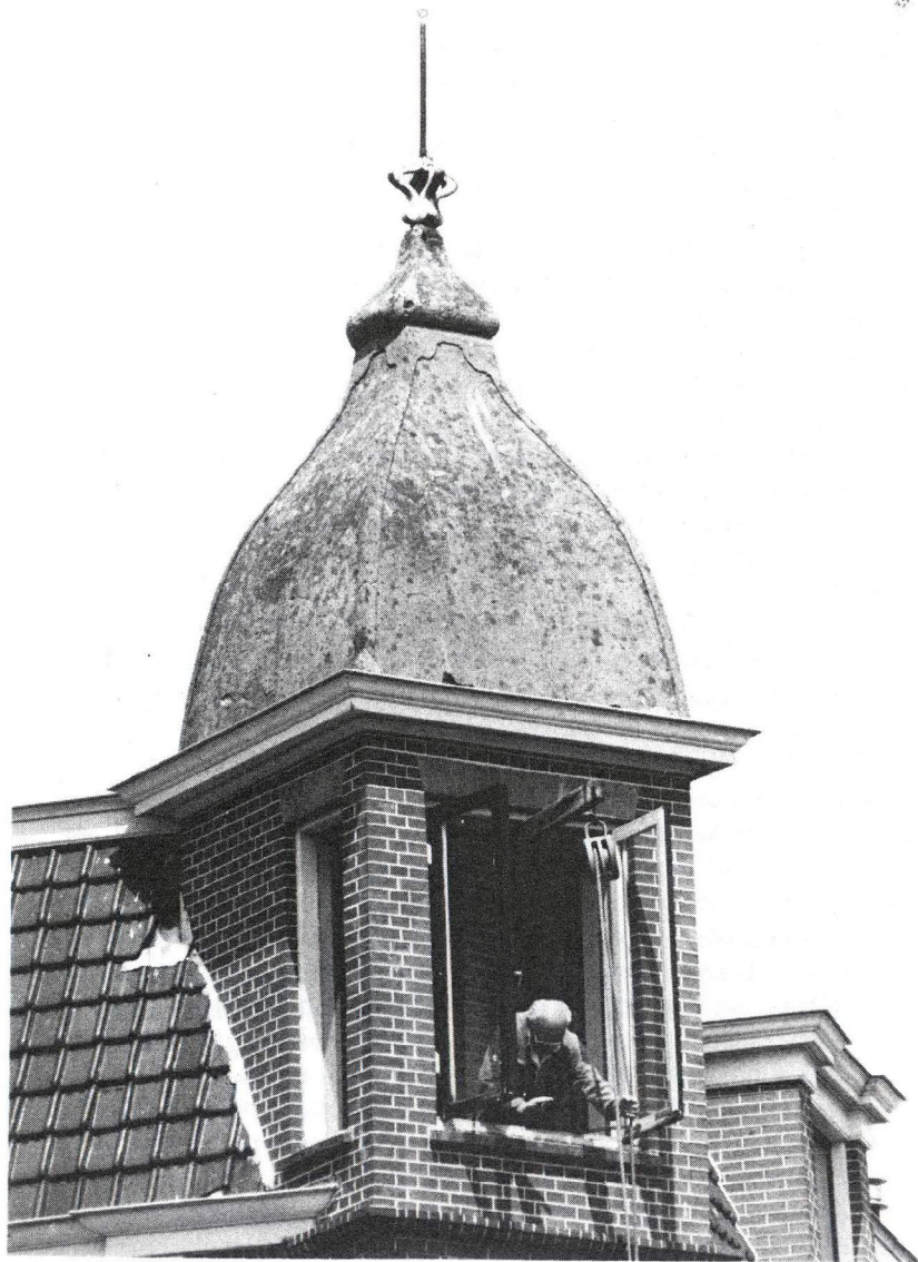
Afb. 2 Oudegracht 164-166. De in 1903 van een betonlaag voorziene dakconstructie van het hoektorentje.

ons land een soortgelijk dak kent of vermoedt, Trouwens, ook naar andere voorbeelden van de toepassing van prikkeldraad als (krimp)wapening zijn wij benieuwd.