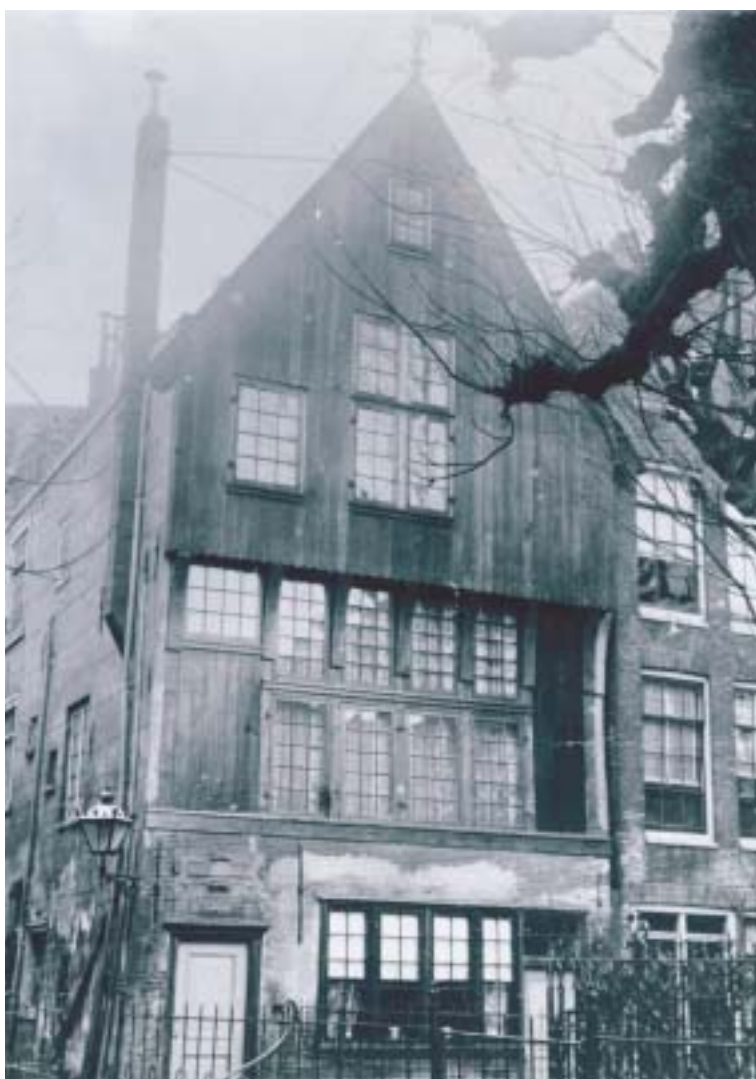
1 Het Houten Huys aan het begin van de twintigste eeuw. Bureau Monumenten & Archeologie.

jongere literatuur is een grote spreiding te vinden, van het begin van de vijftiende eeuw, 9 het midden van de vijftiende eeuw 10 , derde kwart of de tweede helft van de vijftiende eeuw. 11 Deze dateringen zijn vooral gebaseerd op de gotische versiering van de sleutelstukken onder de balken, een vormentaal die in Amsterdam echter nog tot zeker 1550 is toegepast. 12